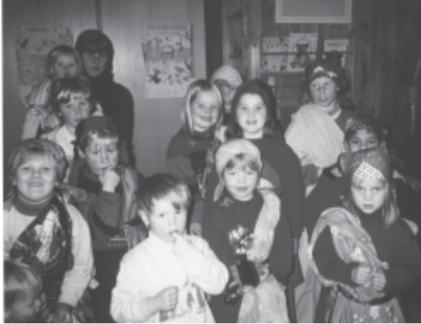
Her øver vi og skal spille Sakkeus