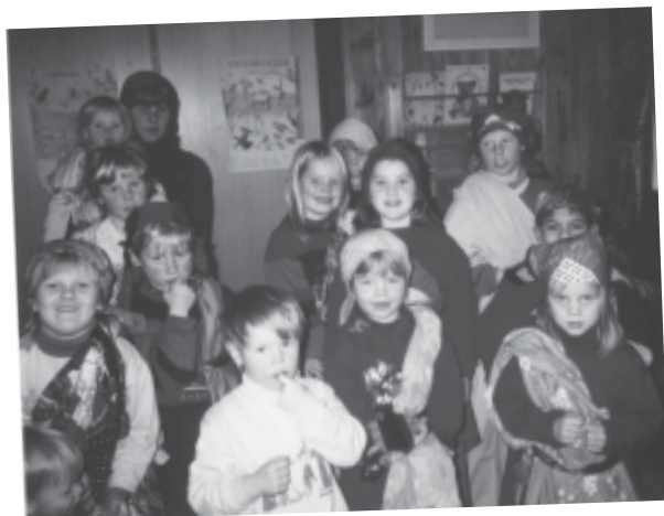
Støle og Levang søndagsskole har 30 års jubileum