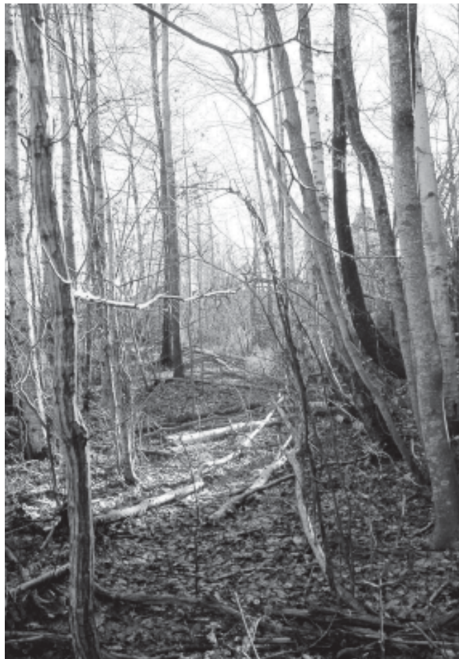
Veien mot vinteren