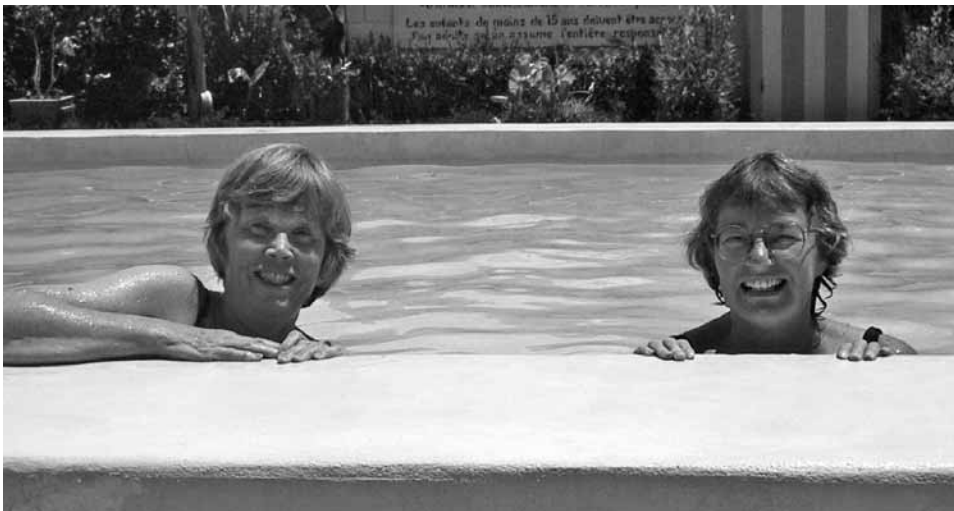
Heldigvis ble det også tid til en avkjøling i bassenget

Det ble mange inntrykk på kort tid. Møtene med de døve barna og den store vennligheten vi møtte, ser vi tilbake på med stor glede.