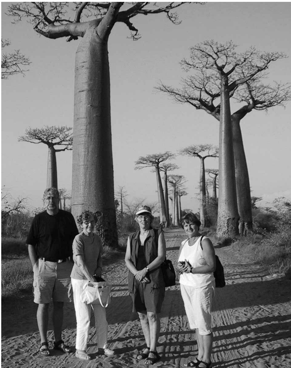
Bao-bao trærne er typiske for Madagaskar. Her er vi sammen med representanter for døvearbeidet i Norge.

Det var stor forskjell på byene vi besøkte med hensyn til klima, natur og folkeliv: I Antsirabe har befolkningen tydelige trekk fra Østen, og bygninger og bruk av richawer til transport forsterket det asiatiske preget.