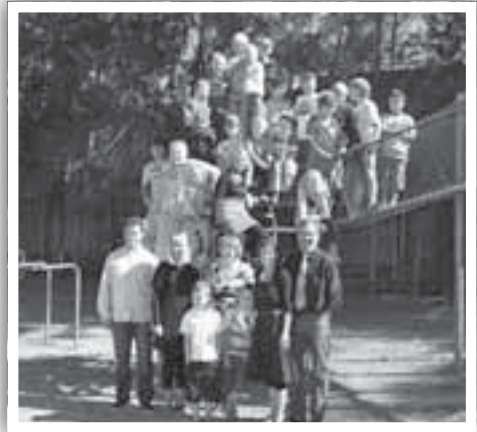
Her er elevene fra Arequipa og Juliaca samlet første skoledag.

Vi stortrives i vår nye tilværelse. Vi bor bra. Fint hus med god plass. Vi har fått mange nye gode venner. 6 norske familier