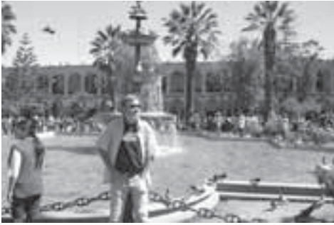
Tron på Plaza de Armas. Byens stoltbet. (Plazaen altså).

Misjonærene her gjør en flott jobb. De er med å bygger nye menigheter, underviser lokale medarbeidere og driver spennende ungdomsarbeid, ikke ulikt det vi holder på med i Norge. Vår oppgave er å gi barna deres god skolegang, slik at de kan konsentrere seg om sitt viktige misjonsarbeide. Vi er glade for hvert eneste av de ca. 60 års undervisningserfaring vi har til sammen. Og vi ser og vet at vi vil komme hjem til skolene i Sannidal og til menighetslivet hjemme med mange nye erfaringer og impulser. For hjem kommer vi om to år. I mellomtiden får dere huske på oss her oppe på samme høyde som toppen av Galdhøpiggen. Snakket noen om høydetrening?