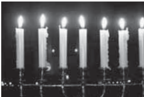
Late Night Service