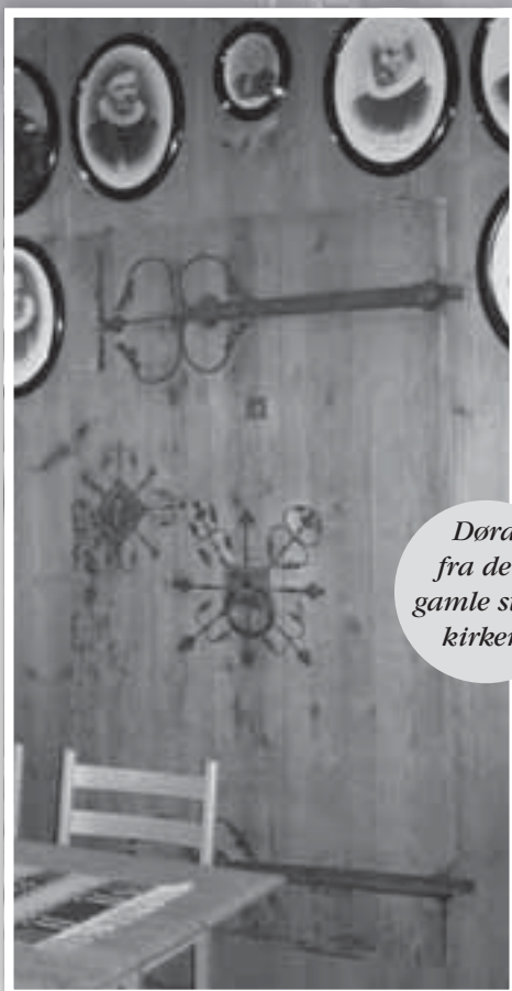
Døra fra den gamle stav- kirken.

Våpenhuset i Sannidal kirke ber oss om å komme inn i kirken. Dørene inn til Sannidal kirke vil hjelpe oss å komme på innsiden av kristen tro.