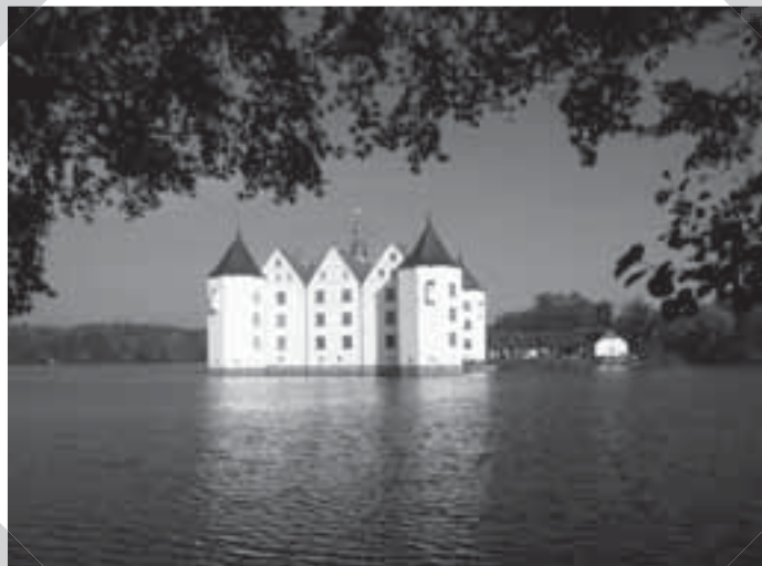
Vannslottet i Glücksburg.