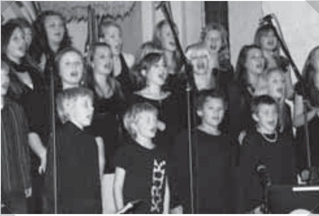
Konsert i Borby kirke onsdag kveld.

som hadde stått for organiseringen, og en stor del av menigheten var satt i sving med å lage det deilige måltidet til oss! Vi prøvde å blande oss så godt vi kunne under måltidet, slik at vi kunne bli litt bedre kjent med hverandre. Etter maten hadde vi litt felles program med sang og bl.a. en bildepresentasjon av Sannidal og menighetslivet der. Så var det tid for turnéens aller siste konsert, og nå skulle alle gi