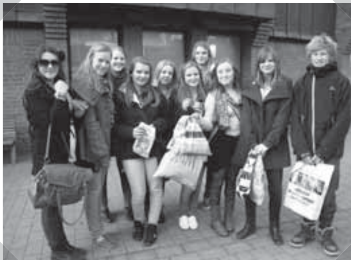
En fornøyd gjeng etter shopping i Flensburg