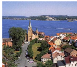
KRAGERØ KIRKE: Teglsteinskirke fra 1870. Den ble restaurert og pusset opp innvendig i 1996 og 2010.