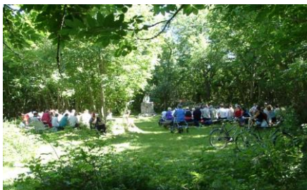
ANKERPLASSEN, FRILUFTSKIRKEN PÅ JOMFRULAND

De som velger å gifte seg i Friluftskirken må merke seg følgende: