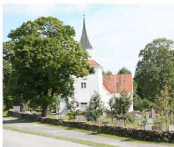
SANNIDAL KIRKE: En vakker, tømret korskirke fra 1772.