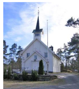
STØLE KIRKE: En sjarmerende liten trekirke fra 1892 ved den gamle kystveien mellom Kragerø og Risør.