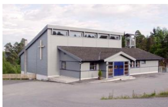
HELLEKIRKEN: En moderne arbeidskirke. Første byggetrinn ble vigslet i 1986, innviet i 1994. Kirken har 200 sitteplasser